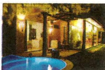
Nella foto: La magia della notte alle Villas do Pratygy. Sorgono su un magnifico promontorio che si affaccia sul Golfo di Maceiò. A 300 metri la suggestiva, bianca spiaggia tropicale

Puntare su Maceiò, città dei signori della canna da zucchero - Sulle spiagge incantevoli e segrete del suo golfo oppure downtown, in pieno centro, si acquistano bilocali da 70.000 euro e ville di fronte all'oceano, con piscine private, a 250 mila. Che si rivalutano dal 10 al 25% all'anno