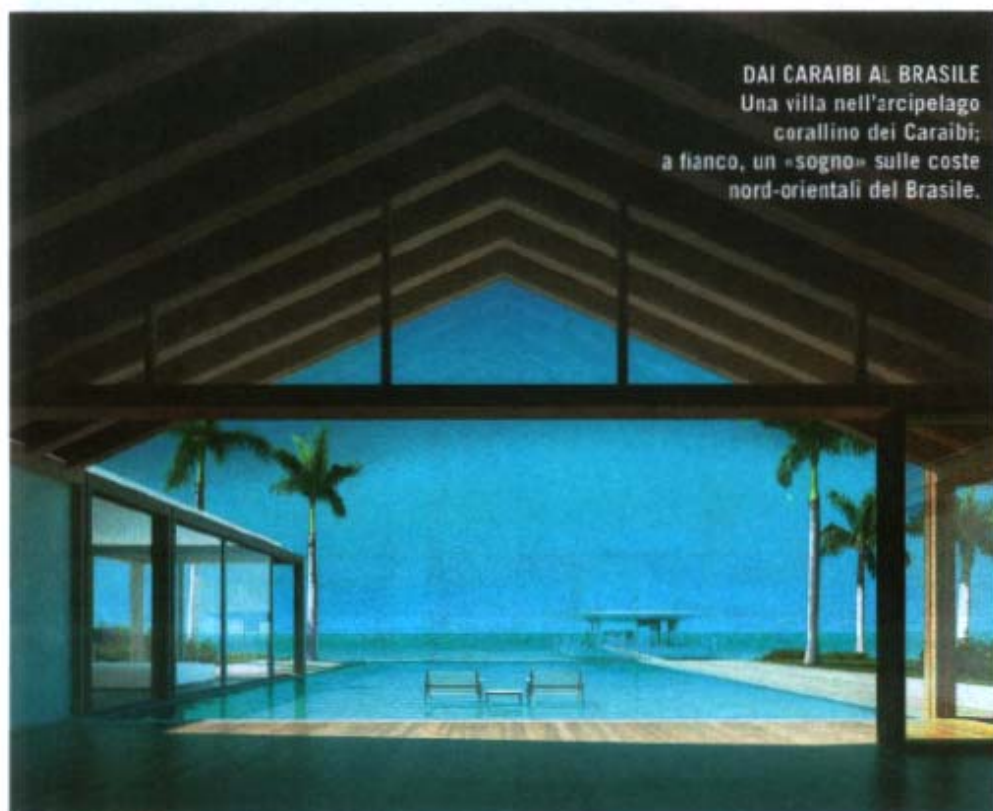
DAI CARAIBI AL BRASILE Una villa nell'arcipelago corallino dei Caraibi; a fianco, un «sogno» sulle coste nord-orientali del Brasile.